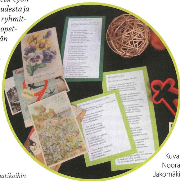
Kuva 1. Eri vuodenaikojen tavaroita muistelulaatikoihin

Aistihuoneen rakentamisessa opiskelijat hyödynsivät Snoezelen-menetelmää, jolla haetaan aktiivisuuden ja rentoutumisen tasapainoa. Aistihuoneen tekoa varten ryhmä kävi kaksi kertaa tutustumiskäynnillä Taavinkodissa, haastattelemassa ja havainnoimassa. Opiskelijat kyselivät asukkailta mieltymyksiä ja heidän tärkeiksi kokemiaan asioita.